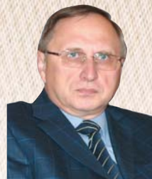
Сергей Осадчий Чрезвычайный и Полномочный Посол России в Австрии